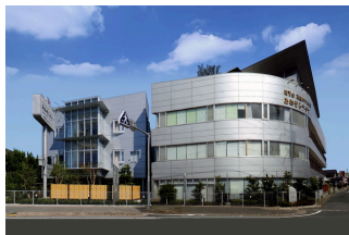
デイサービス「あおぞらライフ」